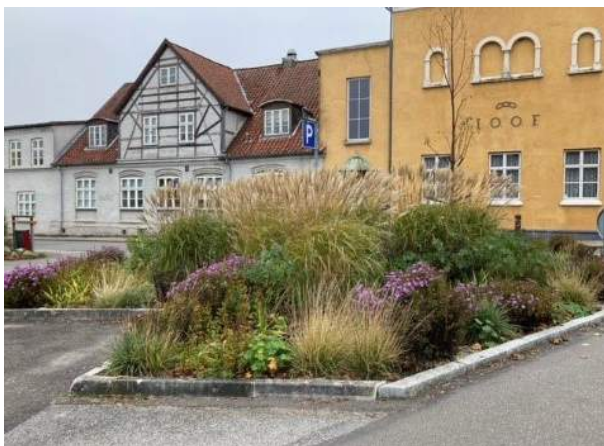
Vintermøde 2021