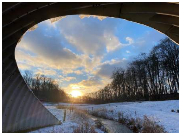
Vintermøde 2021- Foto: Aarhus Kommune.